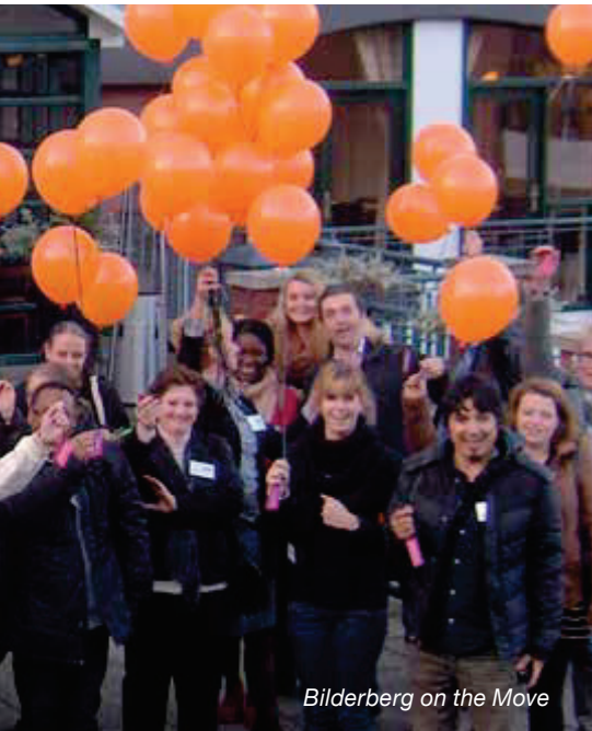
Bilderberg on the Move