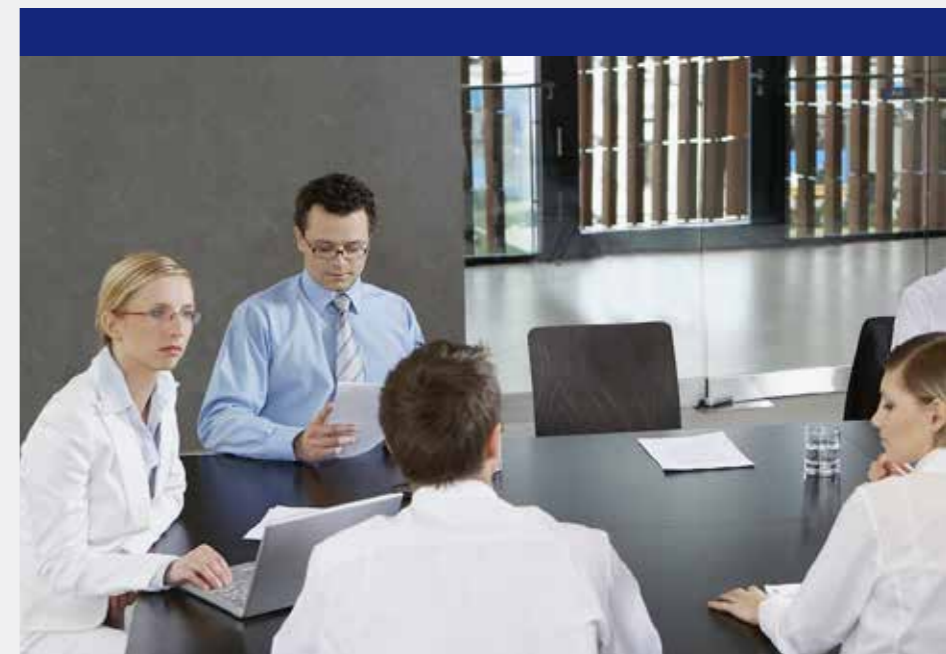
2011-2030: het aantal mensen met chronische ziekte stijgt, het aantal mensen dat zich daardoor beperkt voelt, blijft gelijk

op de arbeidsmarkt als andere mensen en hebben geen extra hulp of ondersteuning nodig. Niet de ziekte zelf, maar de daarmee verbonden gezondheidsbeperkingen zijn doorslaggevend bij het wel of niet kunnen vinden en behouden van werk. Het aantal mensen met een chronische ziekte stijgt de komende decennia, maar het aantal mensen dat zich door zo'n ziekte beperkt voelt, blijft ongeveer gelijk (zie figuur).