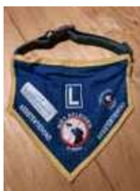
Een van de standaardtuigjes van opleider BMA. De assistentiehonden leren met het tuigje om alert en in hun rol te blijven. Vandaar ook: niet afleiden.

waarvan Bultersmekke Assisteddogs een van de bekendste is. Via hen starten jaarlijks inmiddels rond de honderd koppels aan hun training. Het programma, dat inclusief een jaarlijkse herhalingstraining bij elkaar tien jaar duurt, kost ruim 20 duizend euro. De kosten van hulphonden die extern voor een bepaald doel worden opgeleid, liggen een stuk hoger.