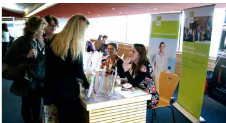
zie www.arbeidsdeskundigen.nl voor meer foto's en collegeverslagen

De Arbeidsdeskundige Colleetour werd mede mogelijk gemaakt door Scolea en SV Land (gouden sponsors) en de (zilveren sponsors) Blik op Werk, CS Opleidingen, Saxion, Vroege Interventie, Capabel Hogeschool en Cover-Arbeidsdeskundige.nl.